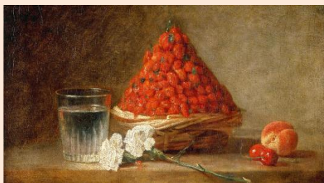
Chardin, « le panier de fraises »