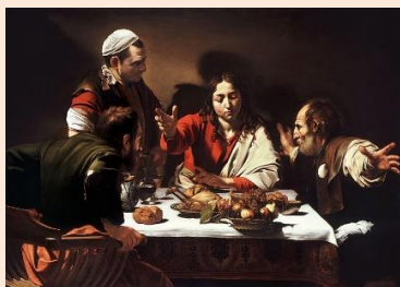
Caravage, « Le repas d'Emmaüs »